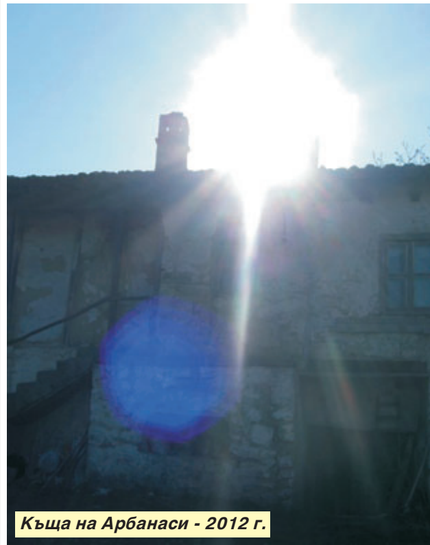
Къща на Арбанаси - 2012 г.