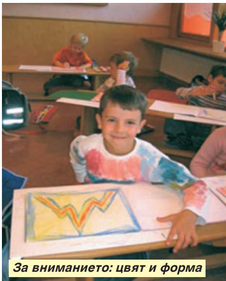
За вниманието: цвят и форма

Заниманието с изкуства е и това, което ме привлече всъщност в този екзотичен на северните народи край. Гер-