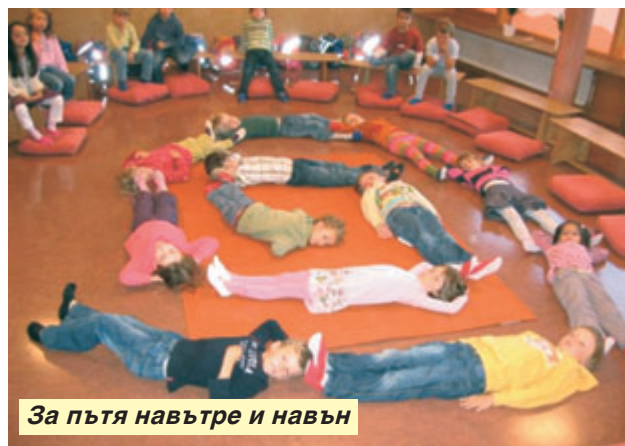
За пътя навътре и навън

В първите основни класове децата изучават два чужди езика (английски и френски или руски). Руският е даден от Щайнер за изучаване като пръв чужд език заради граматическата достоверност на това, което се говори, и на това, което се пише - език, развиващ сетиво за правда.