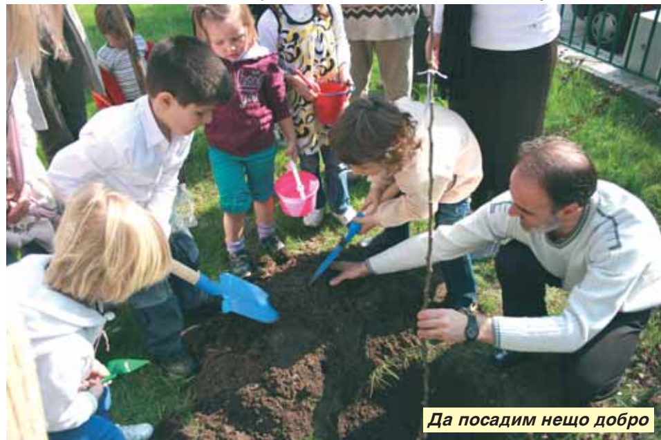
Да посадим нещо добро