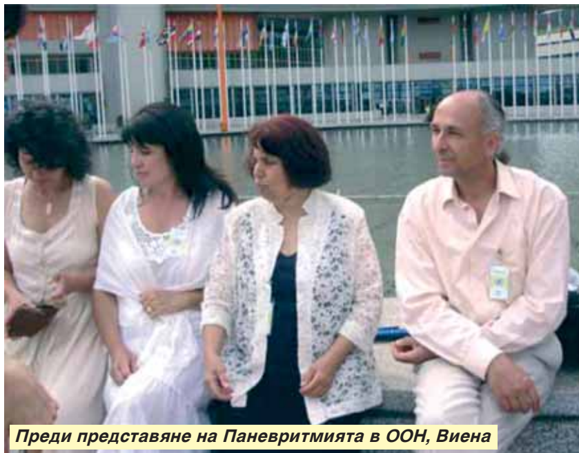
Преди представяне на Паневритмията в ООН, Виена

ги има светли същества - и когато се помолим, те ни дават верния отговор. Дано не съм допускал големи грешки, а за малките се надявам да ми простят.