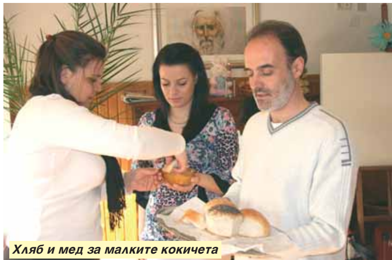
Хляб и мед за малките кокичета

На 4 април отвори врати Детска школа „Бялото кокиче“. Радостни усмивки на деца и родители огряха Братския център.