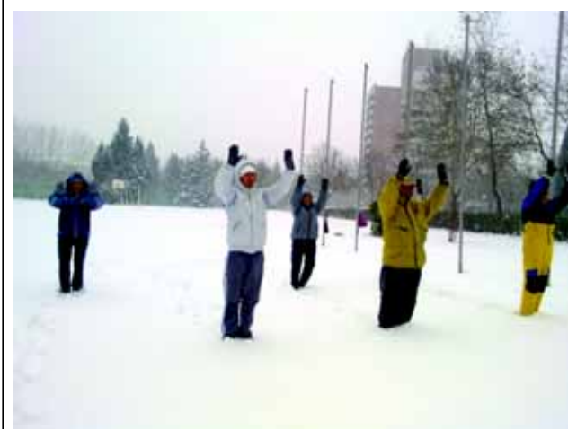
В Бургас ежедневно се играят 21-то упражнения от 22.09. до 22.03

мощно ново мислене - мисълта на колектива. Времето, когато един човек е център на знанието, лека-полека отминава. И това е очебийно за хората, които следят настоящите динамични промени. В епохата на Водолея се изисква събиране на много умове на едно място за реализирането на дадени мисли и идеи. Неслучайно самото Слово на Учителя е под форма на беседи, т.е. то е силно комуникативно и изпълнено с много въпроси и отговори, които се задават директно към учениците. Изнасянето на една лекция не е в самата информация, а в провокирането на всички тези машини, наречени умове, да мислят и да образуват общ ум, който да възприеме новото знание. Клишето на постоянното цитиране или на мълчанието, било то от