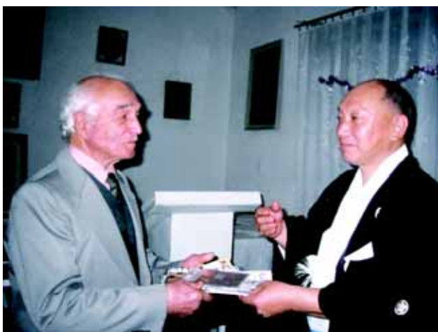
Среща в Айтос с представители на японското духовно движение "Оомото" - 27.12.2004 г.

Много пъти в разговори между приятели е ставало дума за „възрастните“ братя и сестри, за онзи особен дух, който те носят в себе си, за искрената братска любов, която блика и която попиваме при срещите си с тях. Ние особено ценим тези моменти. Случките и опитностите сякаш ни приближават до „Онова време“ и в нас се събуждат дълбоки и вълнуващи усещания и състояния. В началото на новата година искаме да си подарим още един такъв момент и да го споделим с другите чрез страниците на вестника. Листата и цветовете на дървото имат нужда да се обменят с