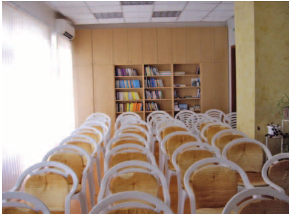
На 9 март 2008 г. новият салон на бургаското братство беше осветен