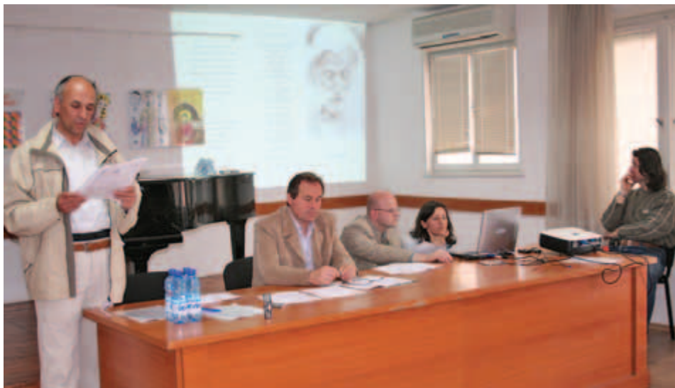
На 19 и 20 април в Пловдив се проведе Общото събрание на Братството