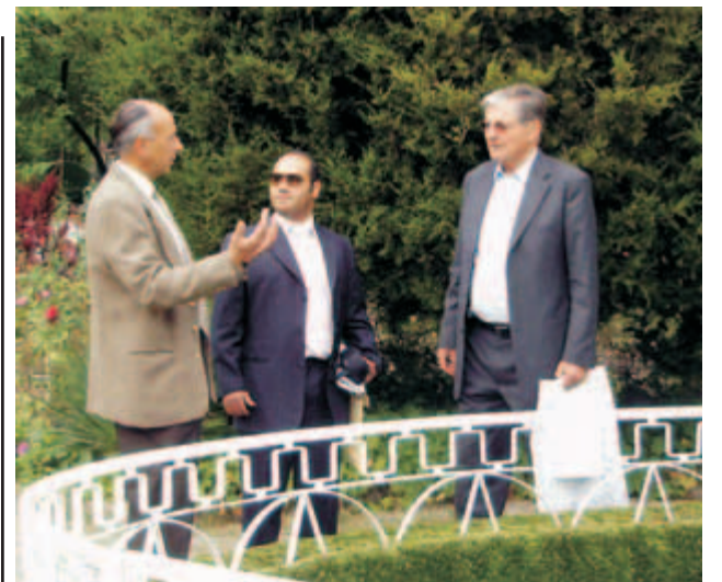
На 10 октомври 2008 г. се проведе международен колоквиум за историята и културата на готите, на който се изслуша представянето на дипломната работа на Учителя

Любовта е колективен акт, а не единичен. Цялата Природа взема участие в Любовта. Като се влюби в някого, човек мисли, че само той изживява любовта си към неговия възлюбен или възлюбена. Но не давате ли път на великата Любов в себе си, ще видите, че това, което наричате любов, не е нищо друго освен каша, лицемерие, кал. За тази любов аз не ви говоря. Вие много добре я познавате. В Новото учение ще учите за Божията Любов.