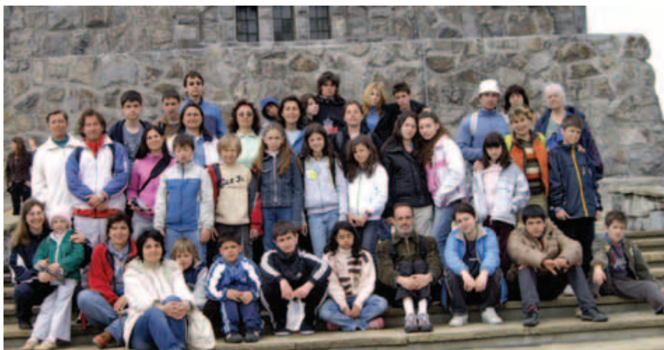
От 28 април до 3 май, в Старозагорските минерални бани се проведе станалия вече ежегоден пролетен детски лагер