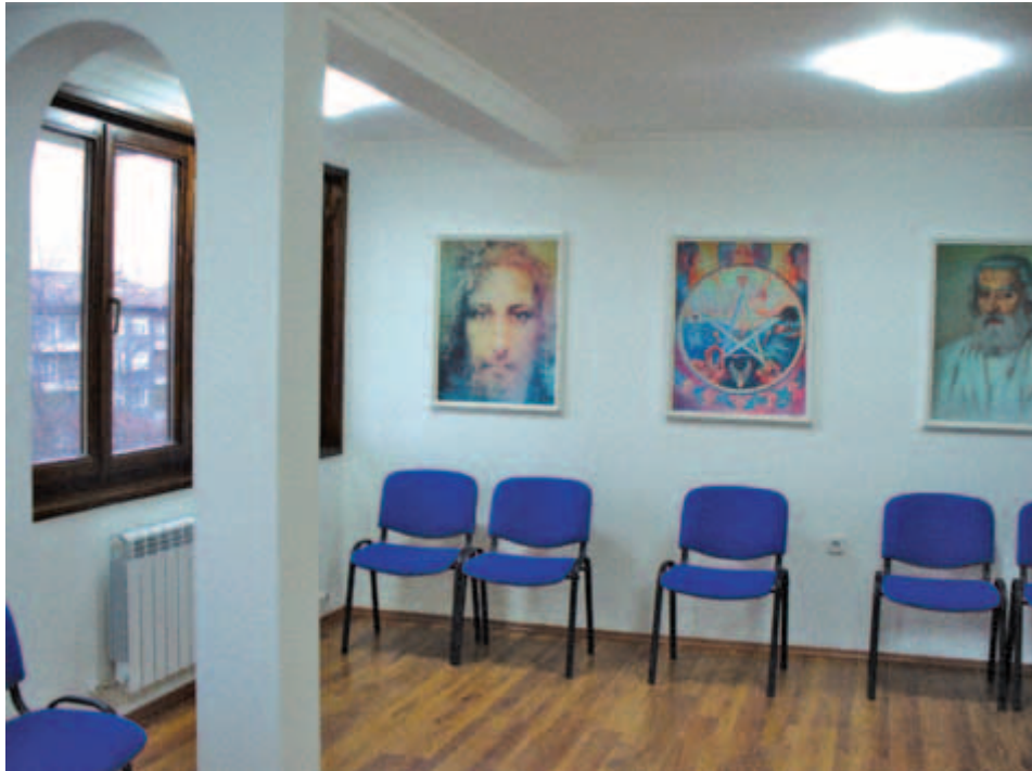
В началото на годината новият братски център в Пловдив отвори врати