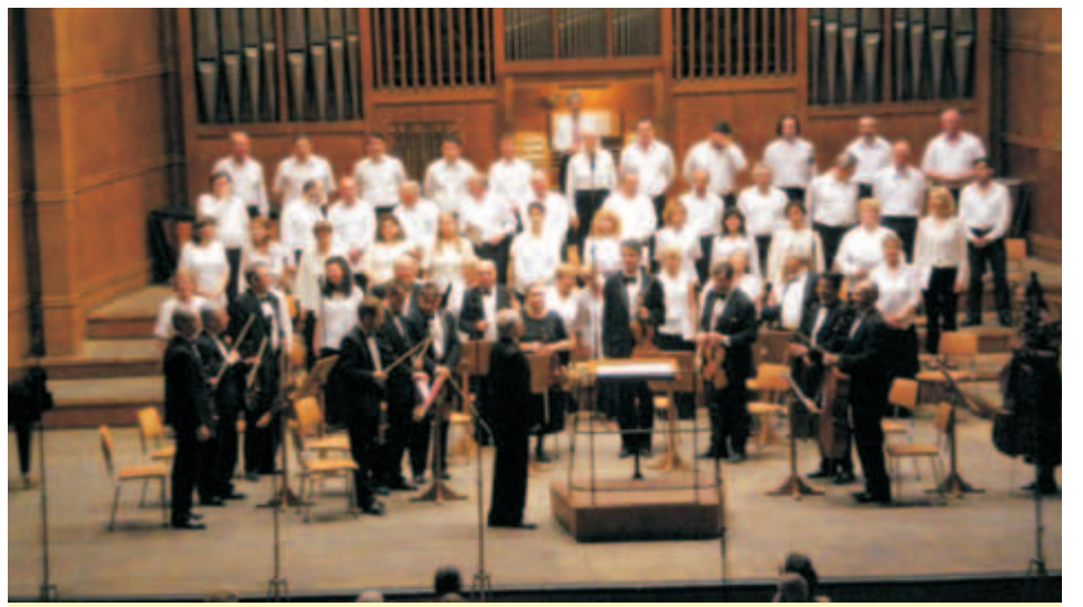
На 26 май 2008 г. в зала България се състоя концертът „Новото битие“ с музика от Учителя