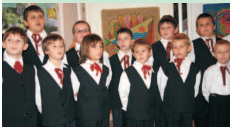
Хор на момчетата „Канон“ гр. Благоевград