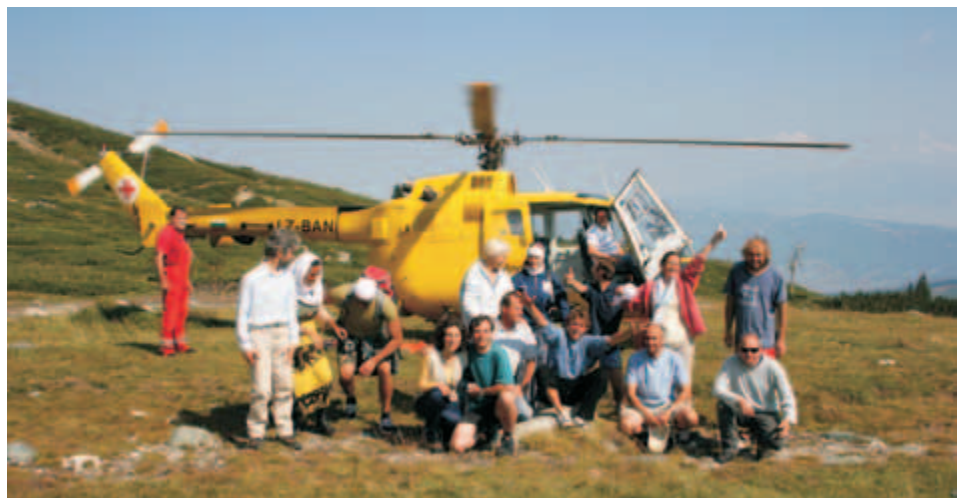
За първи път на Рилските езера беше качен братски багаж с хеликоптер