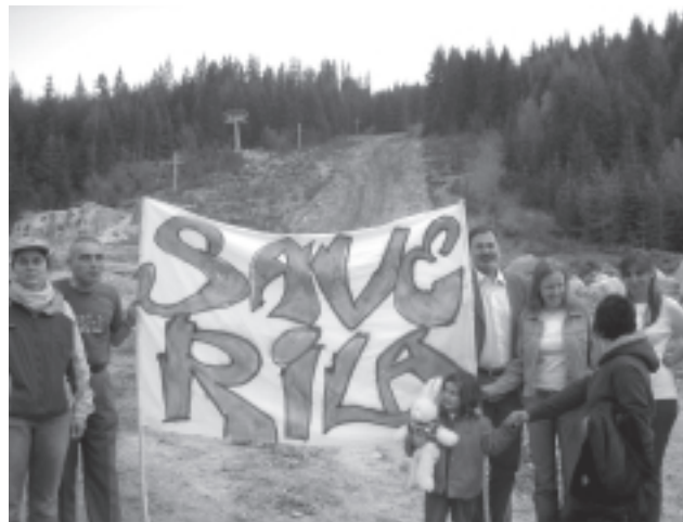
Май 2008 на Рила