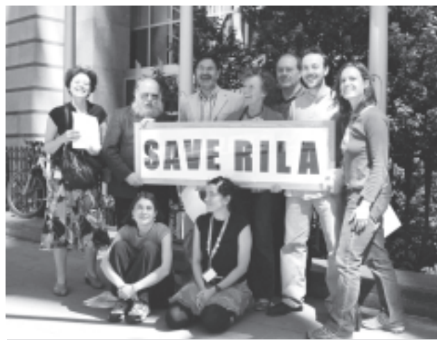
Май 2008 в Брюксел