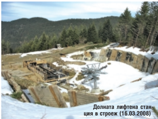
Долната лифтенна станция в строеж (16.03.2008)

те пътеки, създавайки риск от инциденти, замърсяват с изгорели газове и моторен шум и изорават повърхността на езерата! Тръвайки от хижа „Рилски езера“ (новата) те се качват на сухия рид и оттам продължават към „Бъбрека“, правят няколко кръгчета в езерото, после се спускат към „Близнака“, минавайки по цялата му дължина, поспрат се в средата му за по лафче и забръмчат отново към хижа