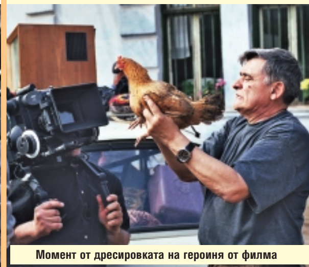
Момент от дресировката на героиня от филма

Аз не съм религиозен, но съм дълбоко вярващ човек. Вярно е, че сравнително рядко ходя на Паневритмия, но ако е малко по-късно – 10-11 часа, сигурно ще съм по-редовен. Паневритмията винаги ме е изпълвала със сила и енергия.