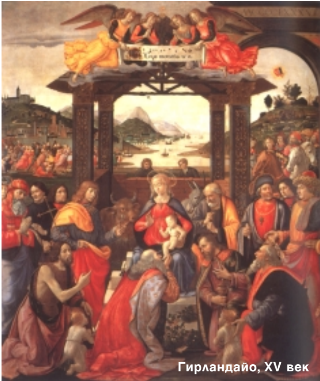
Гирландайо, XV век

Не е правилно да се смята, че само в мозаизма - в книгите на Стария завет - се загатва за идването на Христа. Има свидетелства, че още в атлантско време, хиляди години преди Христа, в окултните школи учениците са били подготвяни за великото събитие в земната история - идването на Христа, Който не е обикновен основател на религия, а е Спасител на човечеството, Който донася свършения закон на Вяра и Любов, а от това зависи бъдещата посока на човешката еволюция. След Христовата жертва се дават