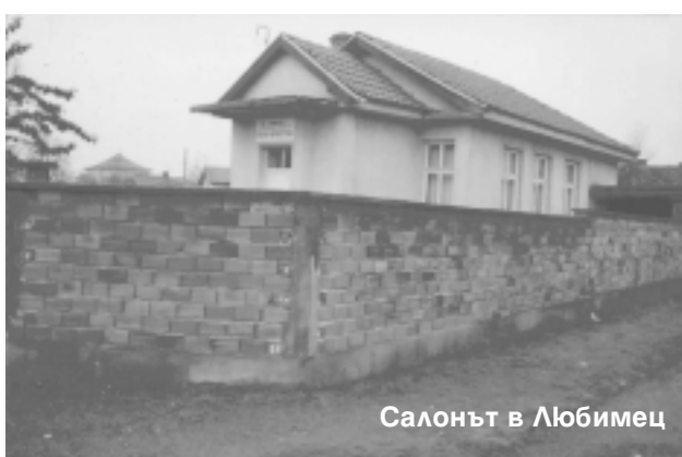
Салонът в Любимец

Писмо от ръководителя на групата в гр. Любимец Димитър Христов Караатлиев