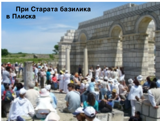
При Старата базилика в Плиска

ния. Тук на това място ние усетихме приемствеността и съпричастността си с духовната мисия на българската държава в новата епоха и съграждащата се нова култура.