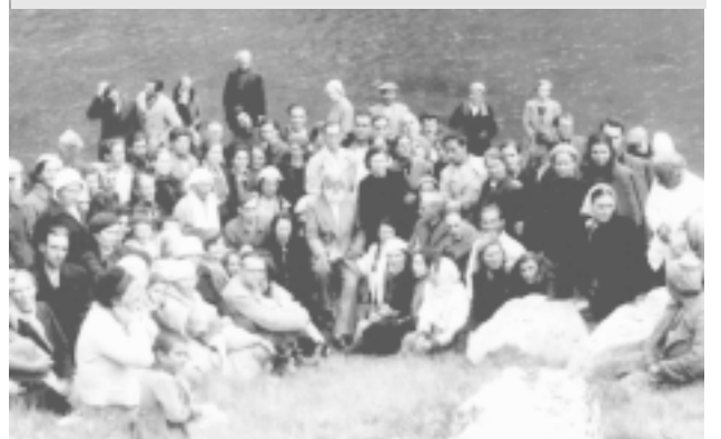
С приятелите от чужбина

Учителя каза: Засага биографията да се изостави, а да се изложат идеите.