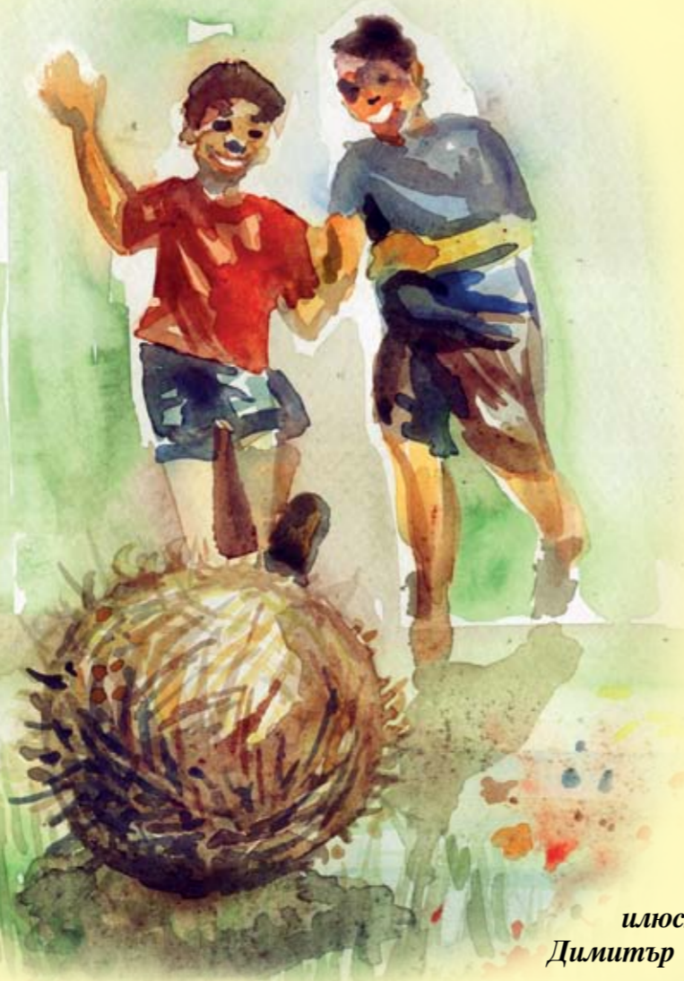
илюстрации: Димитър Бочуков

Пумпали момчетата и момичетата са сътворявали от конусовидно дърво. Около по-широкия край са завързвали въже и щом го дръпнали рязко, пумпалът се е въртял.