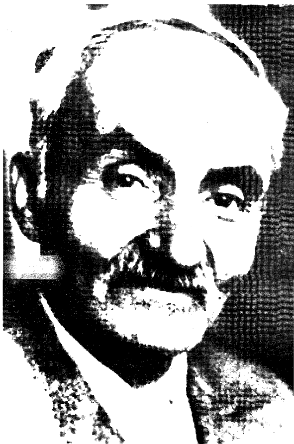
Боян БОЕВ 17.X.1883-21.VII.1963